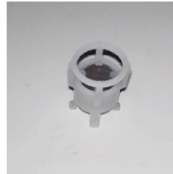
45262200 Поплавок магнитный для датчика протока